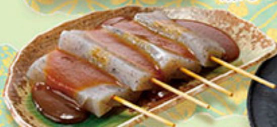
3765 みそ田楽 440円 3911 ミニみそ田楽 240円