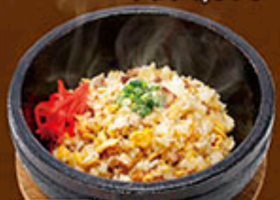
2250 あつあつ 石焼チャーハン 790円 通常のお皿に変更できます。