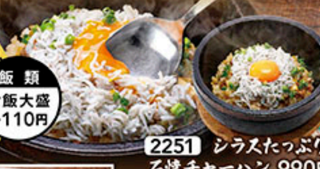
2251 シラスたっぷり 石焼チャーハン 990円 通常のお皿に変更できます。