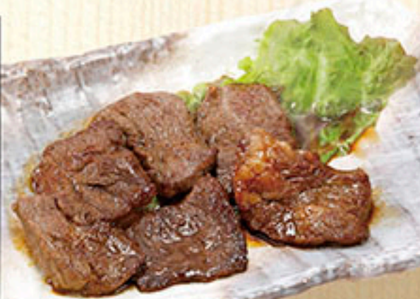
3304 牛カルビ焼き 1,100円