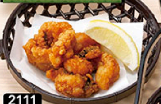
2111 タコ唐揚げ 630円