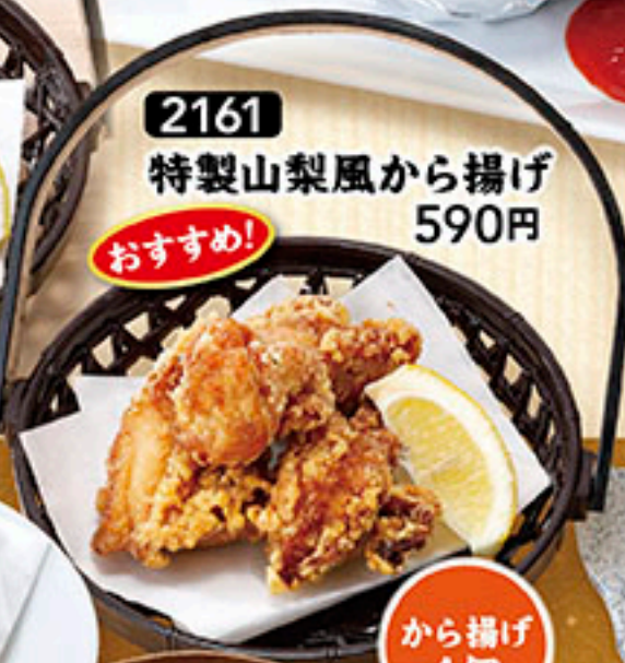
2161 特製山梨風から揚げ 590円 おすすめ!