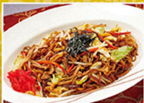
2337 ソース焼そば 890円