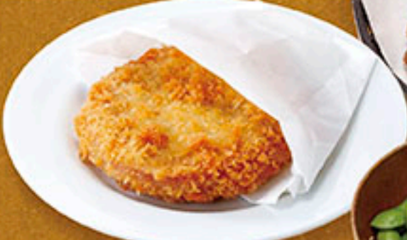
8675 ハムカツ 230円