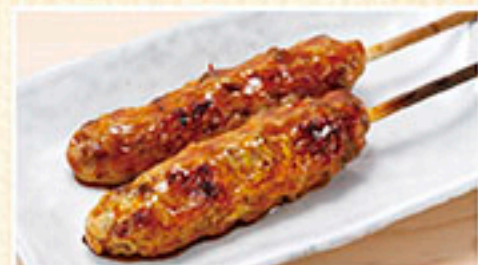
9010 牛タンつくね焼き 490円