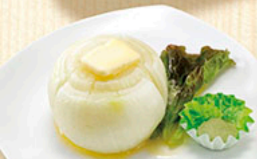
3307 丸ごと玉ねぎ バター蒸し 590円