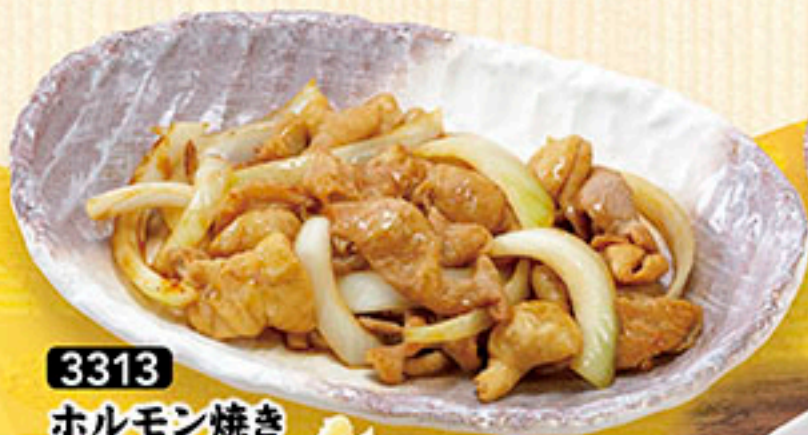
3313 ホルモン焼き 780円