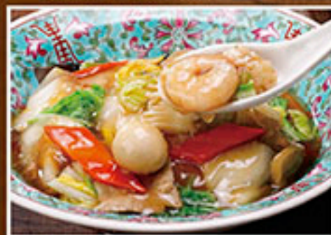
2276 石和の中華丼 890円 2355 ハーフ中華丼 590円