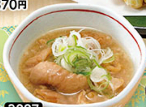
3827 豚もつ煮込み 670円