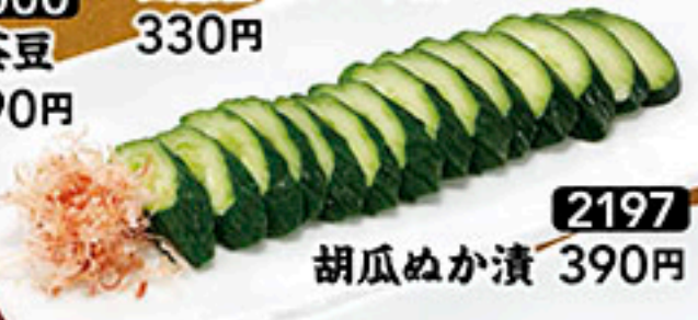
2197 胡瓜ぬか漬 390円