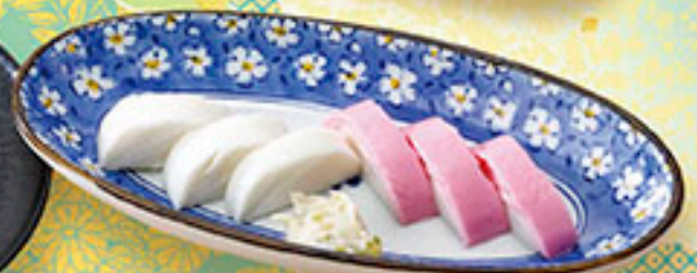
3767 板わさ 500円