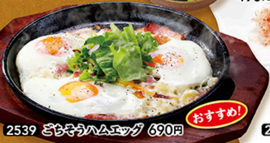
2539 どちそうハムエッグ 690円