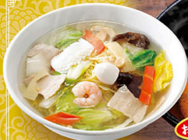
2325 野菜たっぷりタンメン 990円 4112 ハーフタンメン 690円