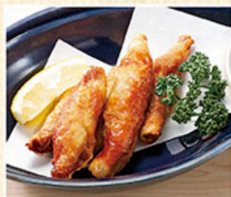
8833 とり皮ギョーザ 690円