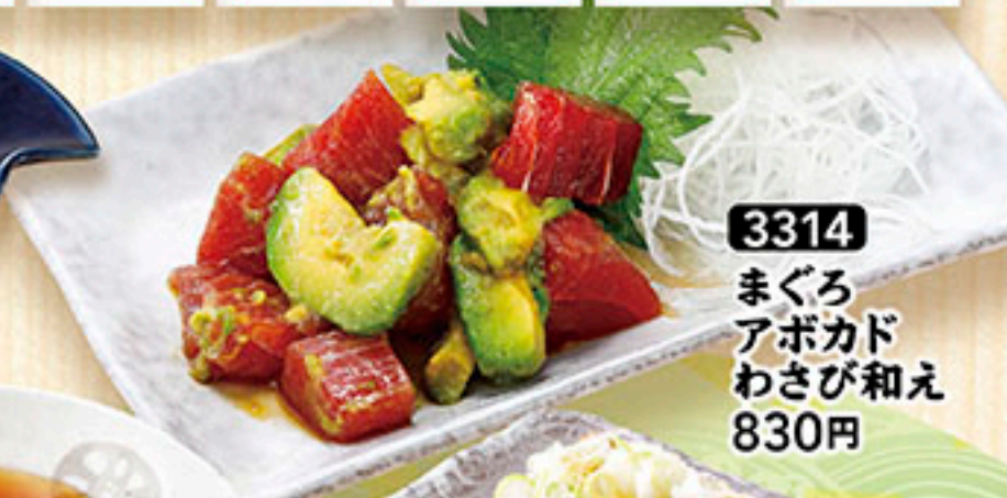
3314 まぐろ アボカド わさび和え 830円