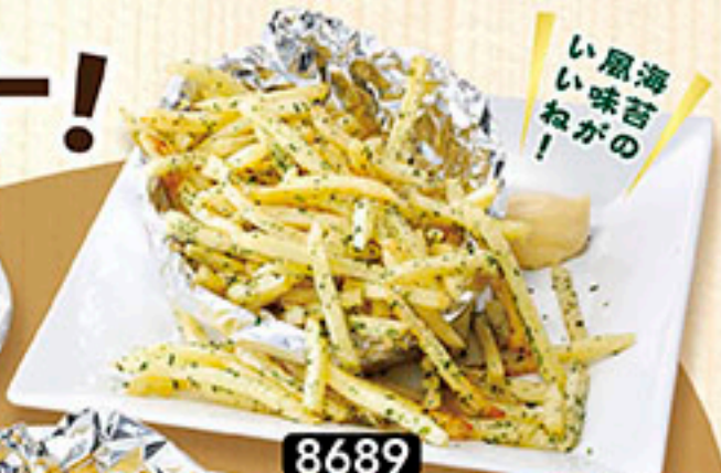
8689 のりしお山盛りポテト 790円