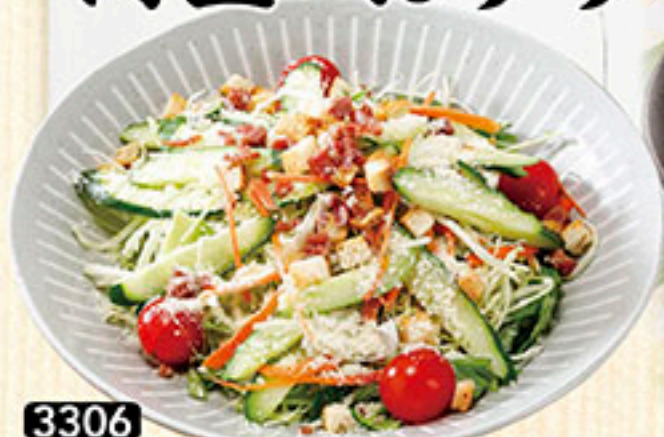
3306 シーザーサラダ 720円