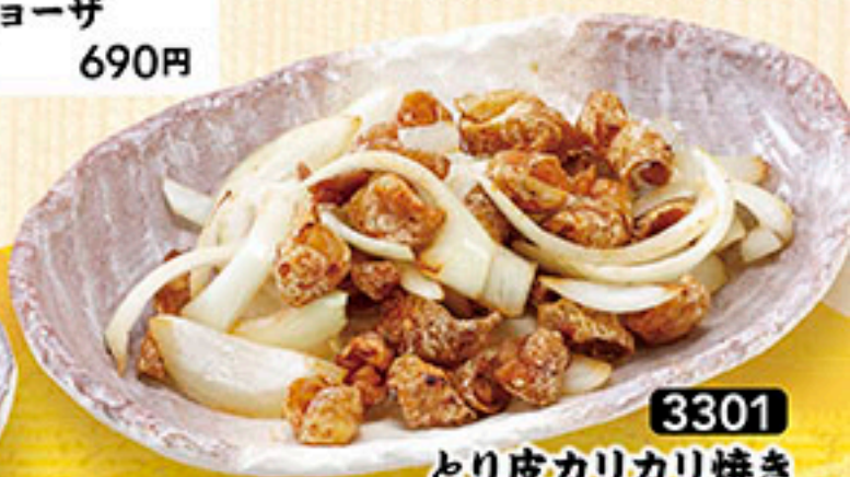
3301 とり皮カリカリ焼き 740円