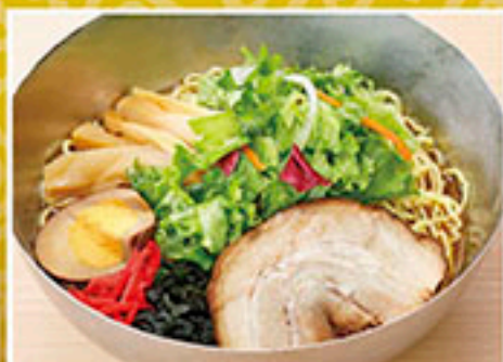
8696 石焼冷やし中華 890円 自家製醤油味