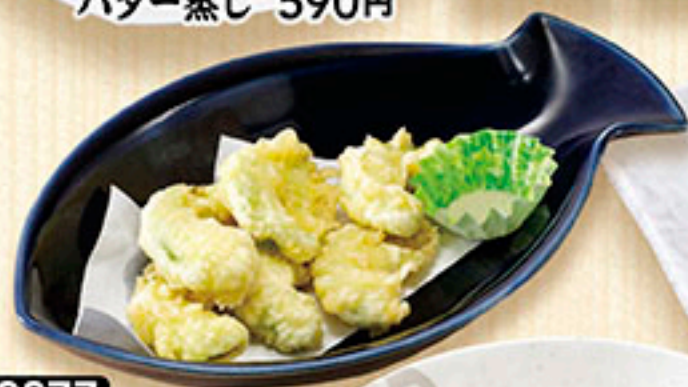
3377 アボカド 天ぷら 630円