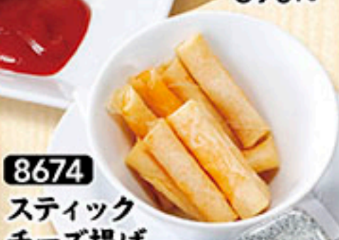
8674 スティック チーズ揚げ 690円