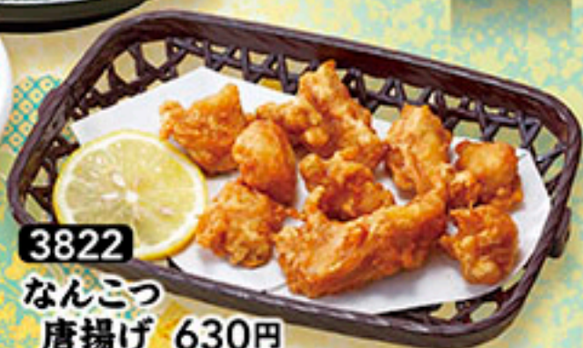
3822 なんこつ 唐揚げ 630円