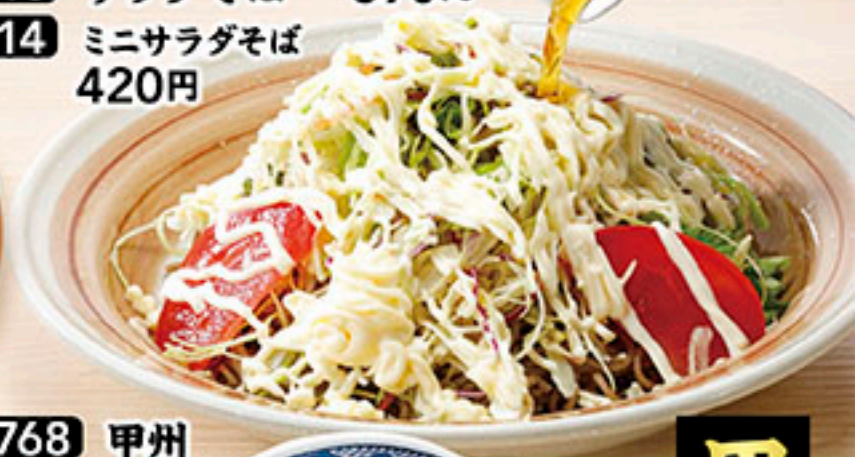
3768 甲州 とりもつ煮 670円