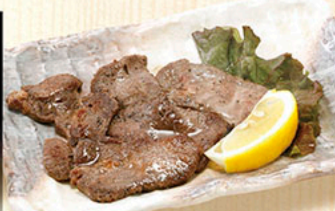
3309 牛タン焼き 1,480円