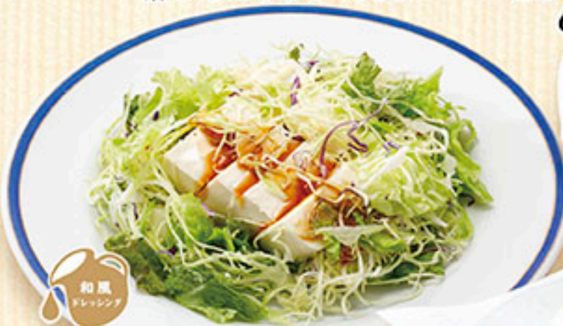
3807 豆腐サラダ 580円 3909 ミニ豆腐サラダ 370円