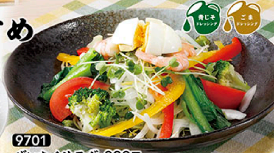
9701 ぜいたくサラダ 880円