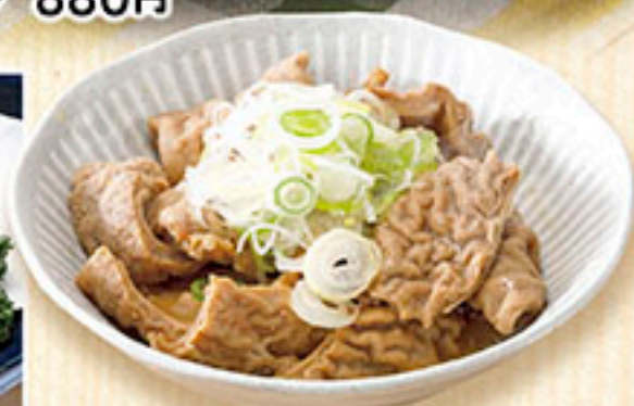
3311 馬もつ 味噌煮込み 630円