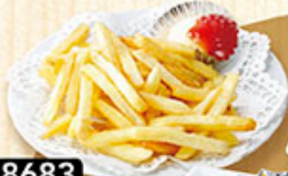
8683 ちよいと ポテト フライ 390円