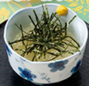
3853 ところてん 440円