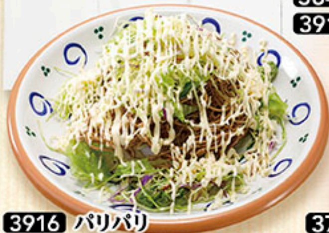
3916 パリパリ 揚げそばサラダ 680円