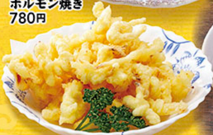
9705 さきいか天ぷら 580円